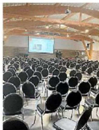
Près de 300 congressistes du 18 au 20 septembre, au Lazaret. P.E.

Ces CAE permettent à un porteur de projet d'exercer son activité indépendante en toute sécurité, en proposant un statut d'entrepreneur salarié qui lui permet de percevoir un salaire et de bénéficier de la couverture sociale d'un salarié classique. Artisanat, services aux entreprises, collectivités ou particuliers, formation, bâtiment, transport... : les secteurs concer-